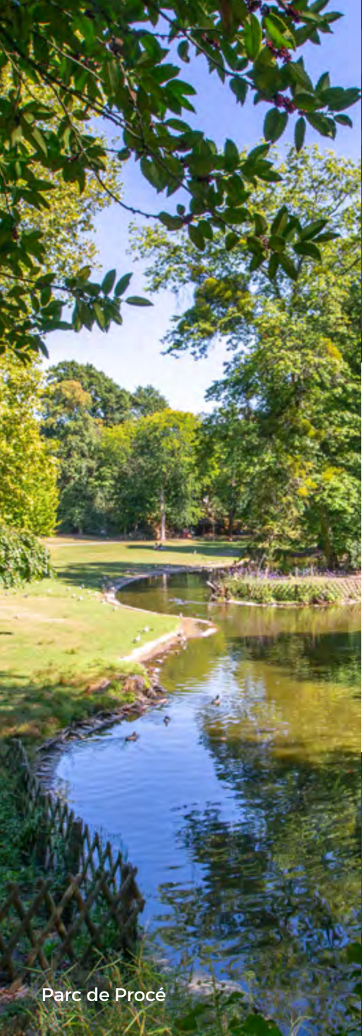
Parc de Procé