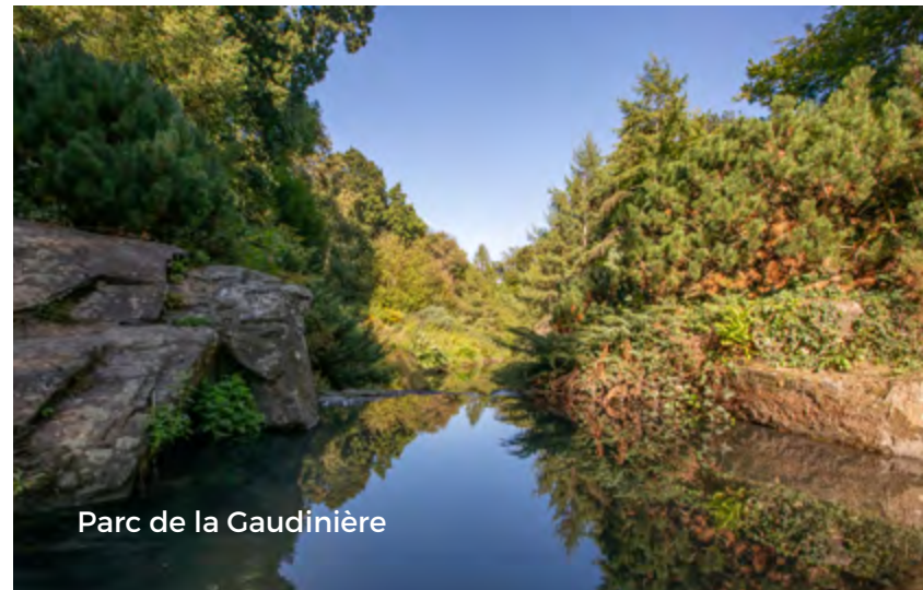
Parc de la Gaudinière