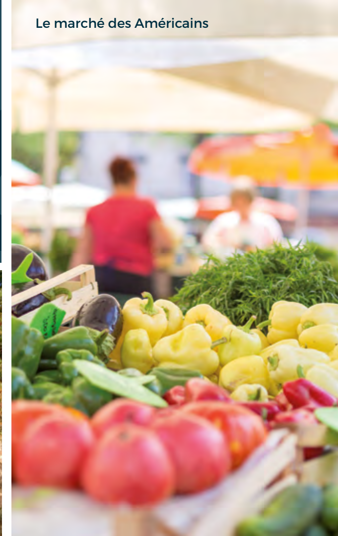
Le marché des Américains