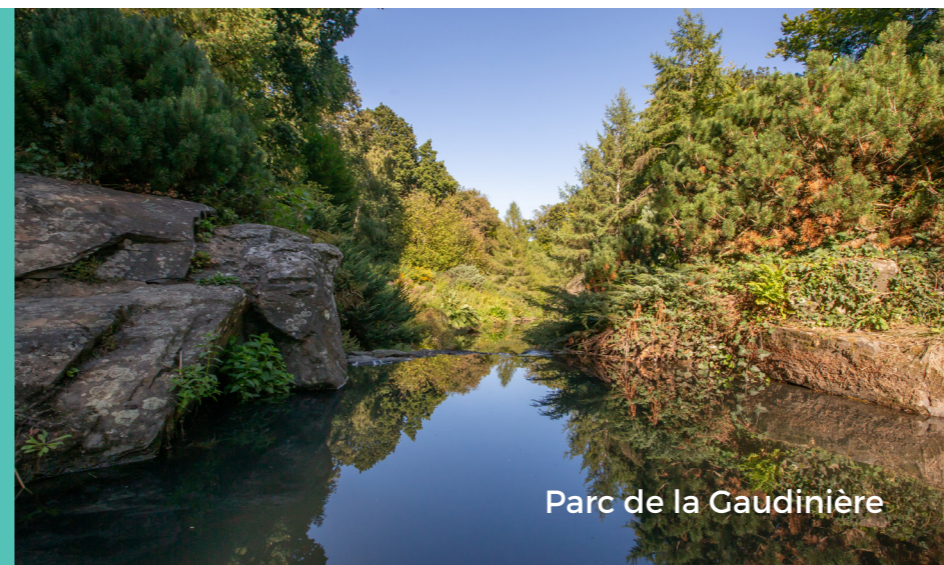
Parc de la Gaudinière