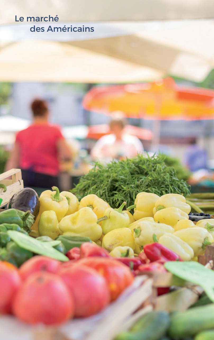
Le marché des Américains