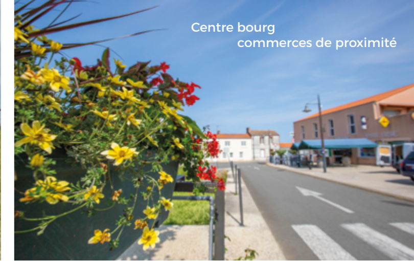
Centre bourg commerces de proximité