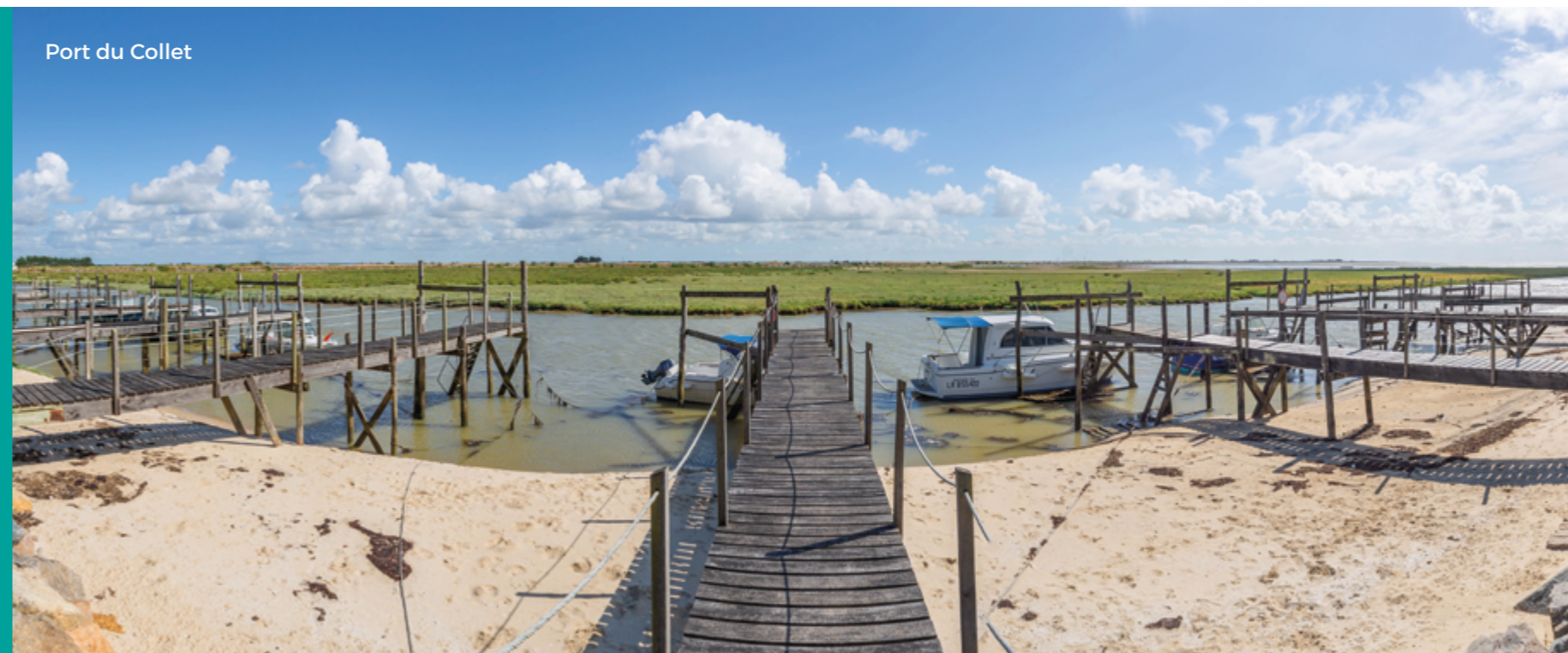
Port du Collet