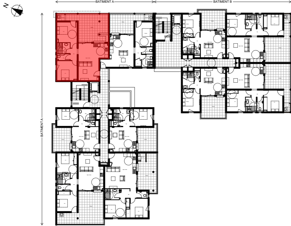
Plan de niveau - R+1 (Rez-de-chaussée topographique)