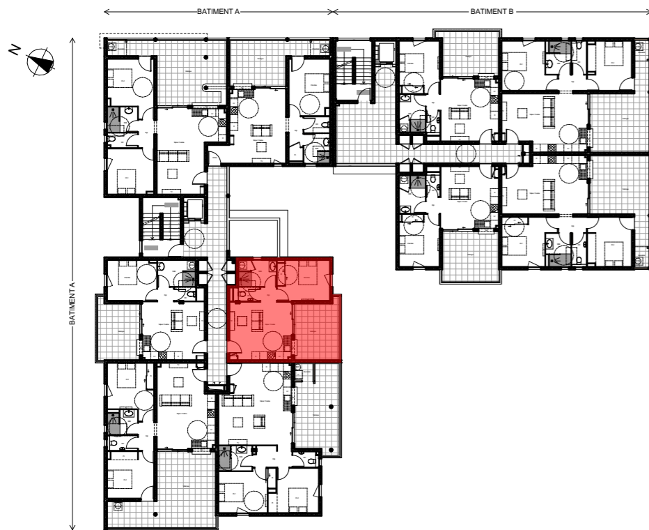
Plan de niveau - R+1 (Rez-de-chaussée topographique)

Bâtiment A - R+1 (Rez-de-chaussée topographique) Lot T2 Type a - n°A103