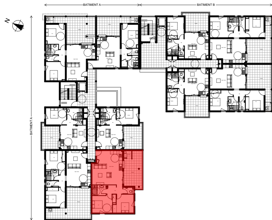
Plan de niveau - R+1 (Rez-de-chaussée topographique)

Bâtiment A - R+1 (Rez-de-chaussée topographique) Lot T3 Type a - n°A104