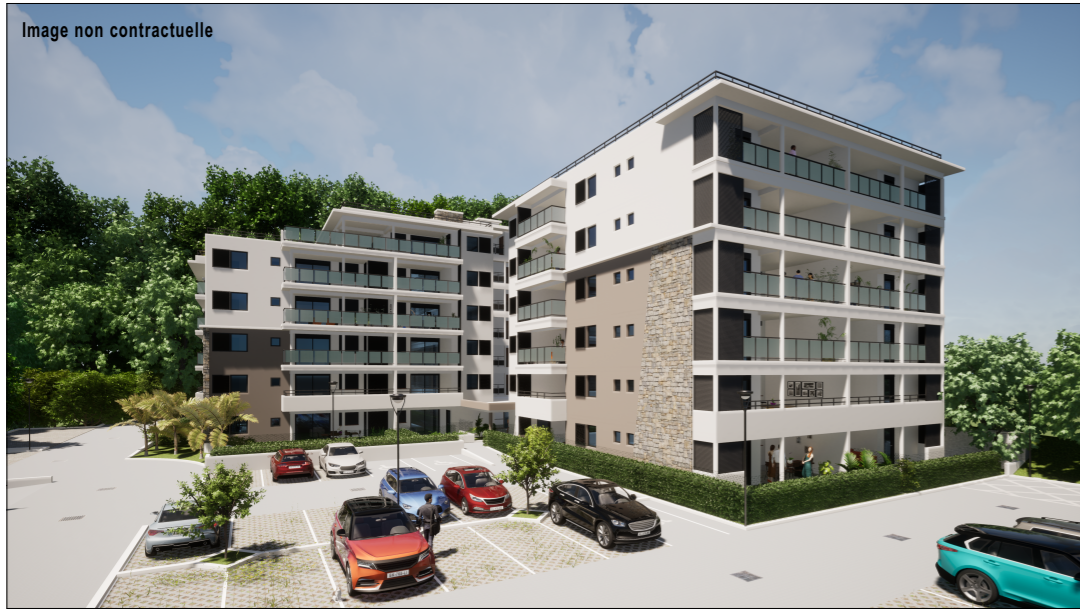
Image non contractuelle