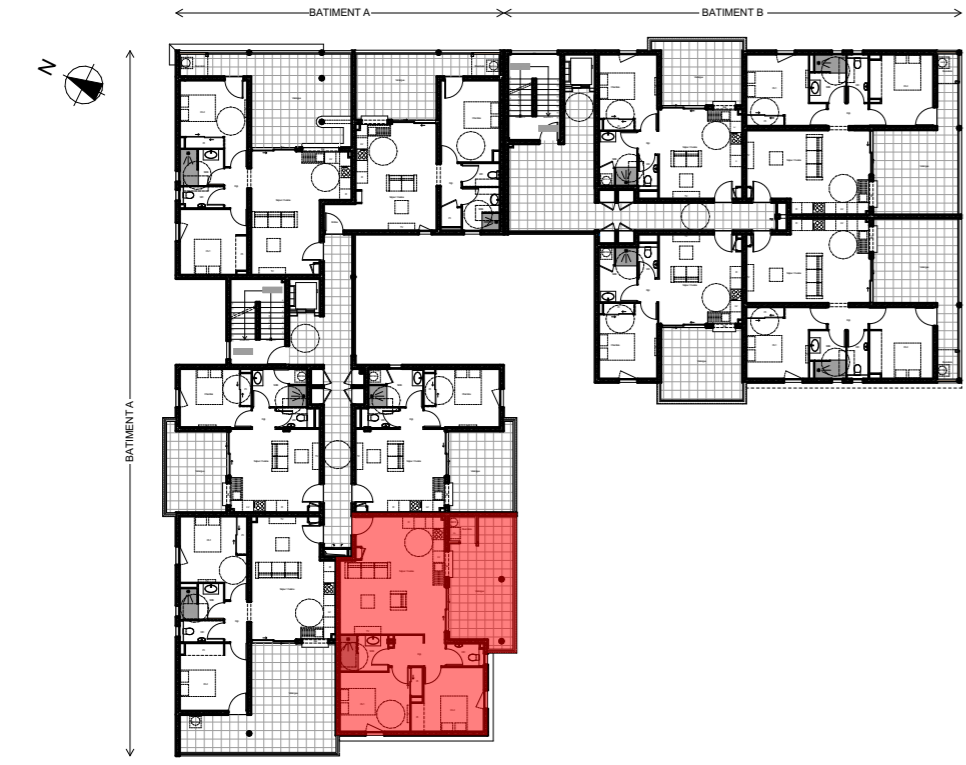
Plan de niveau - R+3 (R+2 topographique)