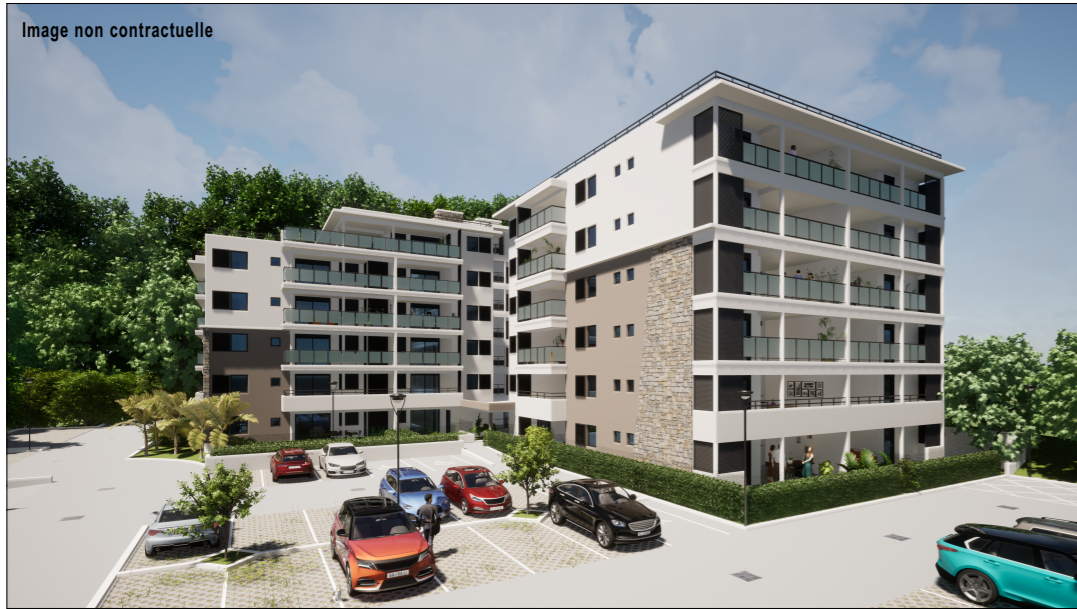
Image non contractuelle