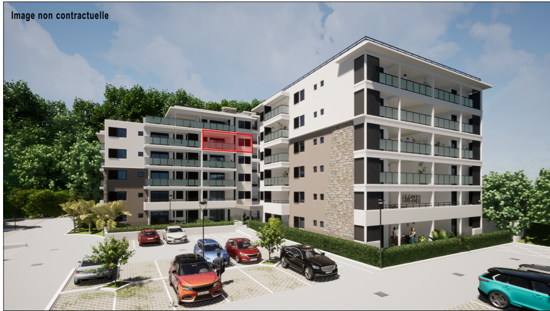
Image non contractuelle