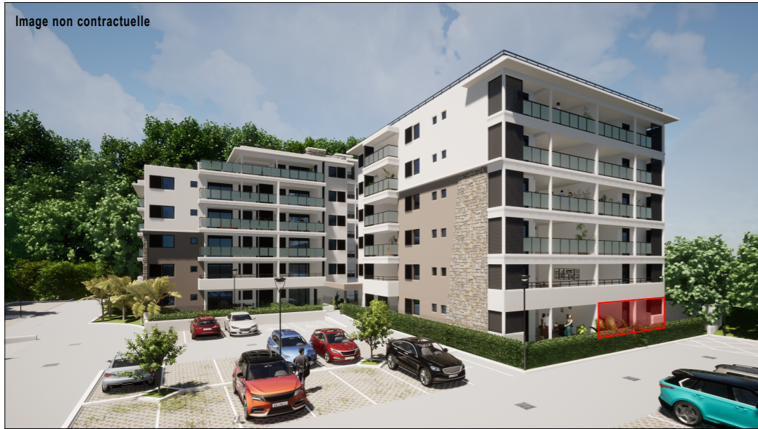
Image non contractuelle