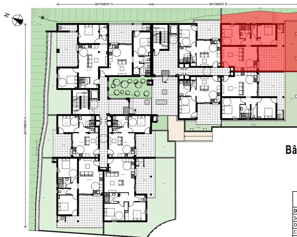
Plan de niveau - Rez-de chaussée/ Accès bâtiment (R-1 topographique)