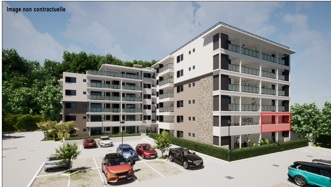
Image non contractuelle