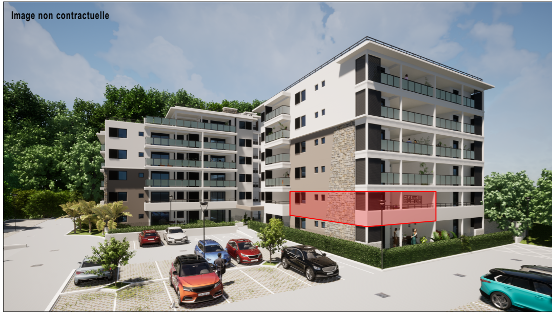
Image non contractuelle