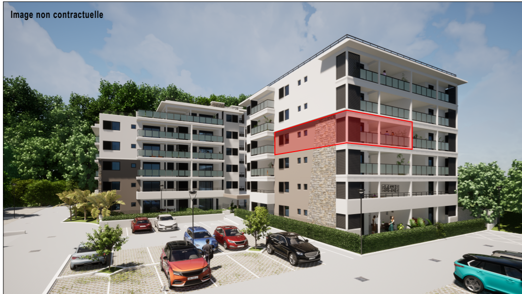
Image non contractuelle