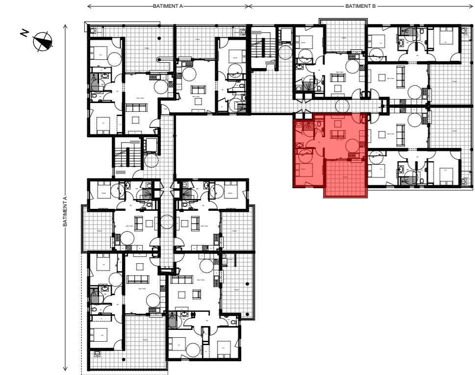
Plan de niveau - R+4 (R+3 topographique)

Bâtiment B - R+4 (R+3 topographique) Lot T2 Type e - n°B404