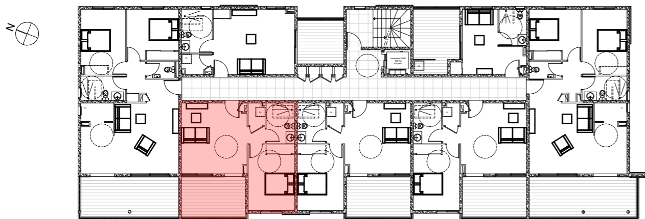
PLAN NIVEAU - R+2