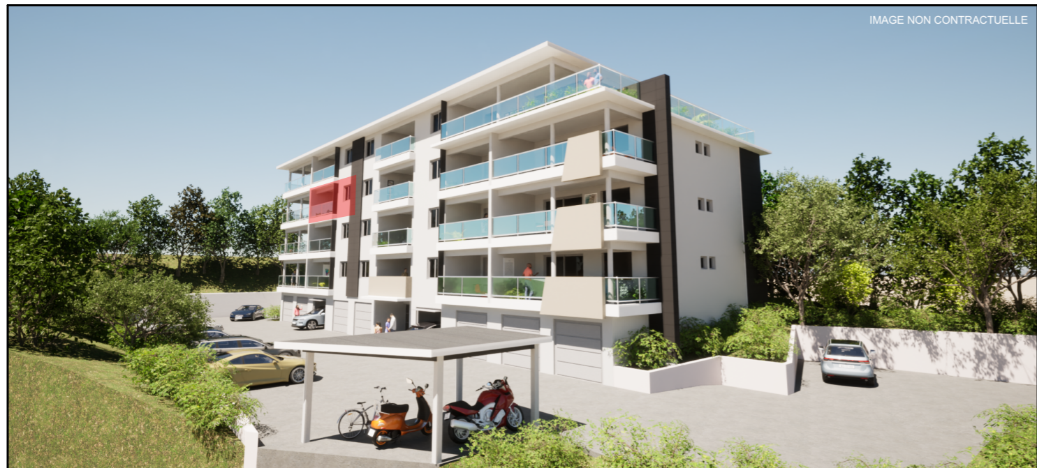
IMAGE NON CONTRACTUELLE