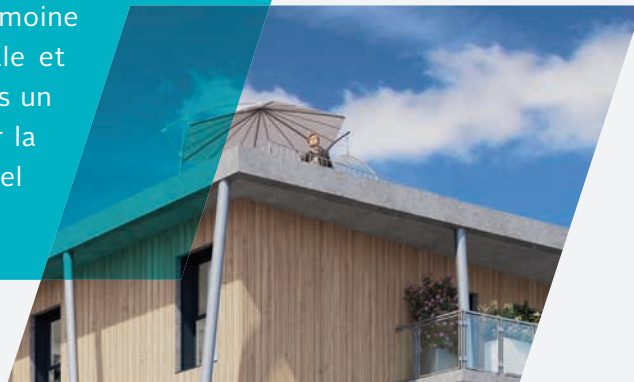
INDIGO ACCUEILLE SUR 206 M 2 DE SON TOIT 6 TERRASSES PRIVATIVES.

Quel que soit votre projet, acquérir l'un des 26 appartements du 2 au 4 pièces de la résidence Indigo participera à vous construire un patrimoine solide. La qualité de son écriture architecturale et de ses prestations comme son implantation dans un environnement naturel préservé et recherché sur la Côte de Granit Rose à quelques minutes de Trégastel et de Lannion constituent des valeurs sûres.