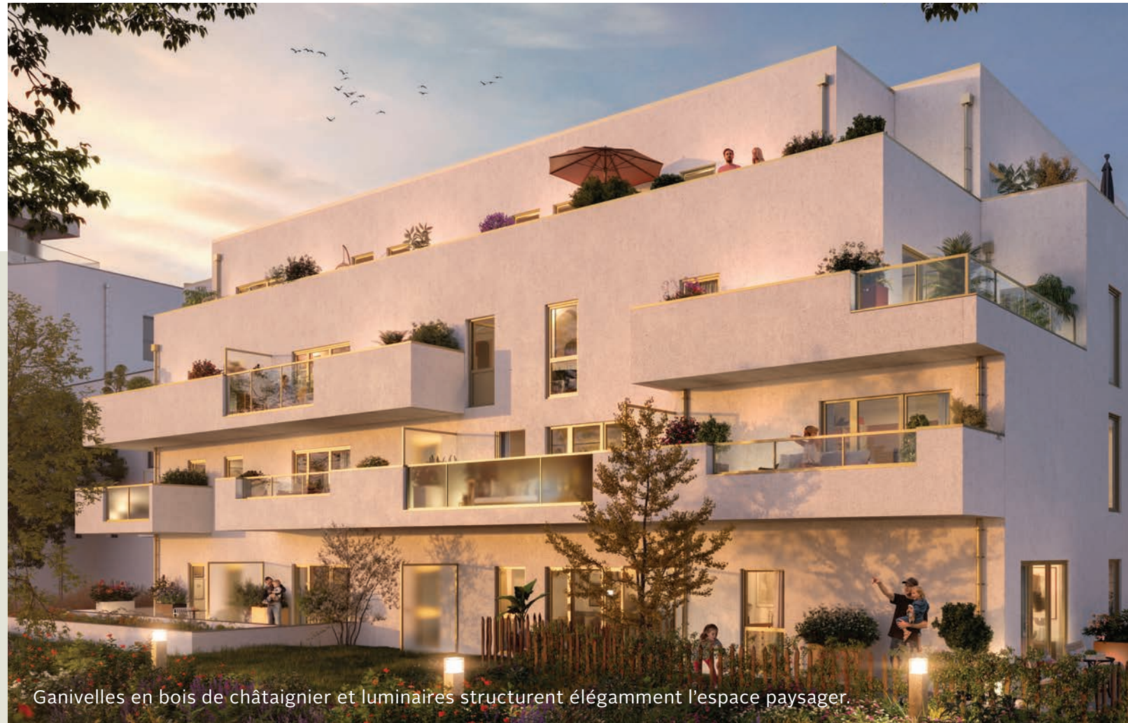
Ganivelles en bois de châtaignier et luminaires structurent élégamment l'espace paysager.