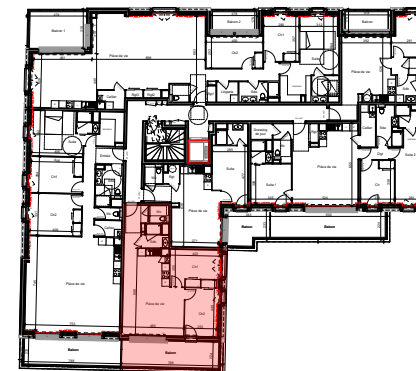
Tableau de surfaces